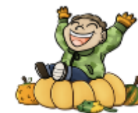
Z DYNIĄ ZA PAN BRAT

Poznamy Dynię i sposoby jej wykorzystania. Obejrzymy pole dyniowe, kompozycje dyniowe oraz wystawę „Jesienne Dary Natury”. Każda grupa otrzymuje dynię do samodzielnego wykonania dyniowego dzieła w szkole lub przedszkolu.